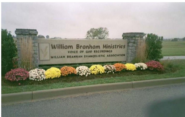
Semnul de bun venit la intrarea în “Voice of God Recordings” în Jeffersonville, Indiana, SUA.