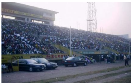
O parte a mulțimii din Kinshasa