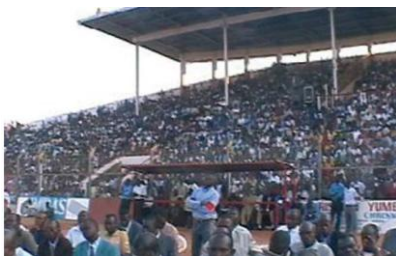
O parte a mulțimii în Lubumbashi