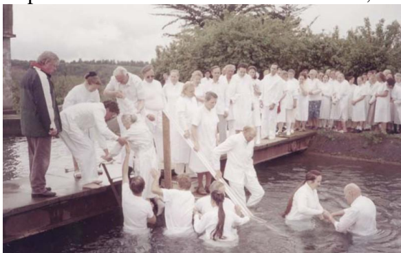
Câțiva credincioși din Chile botezați în Numele Domnului Isus Hristos