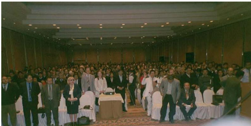
Publicul participând la adunarea din Hotelul Sheraton, Lima, Peru