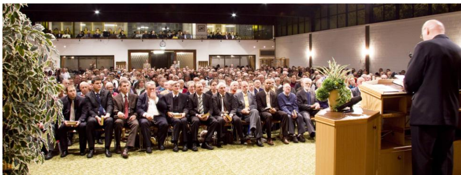
Adunare la Kreleld