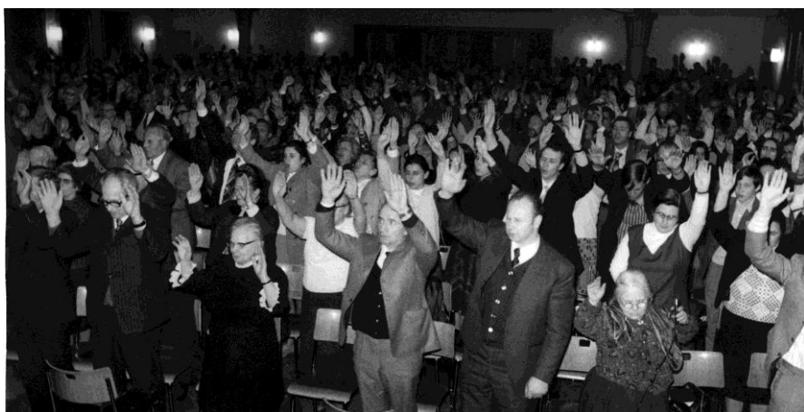
O adunare în Zürich, Elveția – Paște 1975