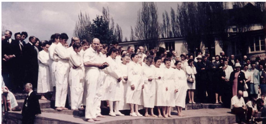
Din 1966 mii de frați și surori au fost botezați în Numele Domnului Isus Hristos