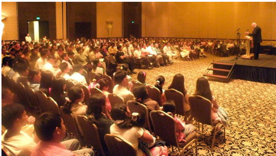
Adunare în Filipine