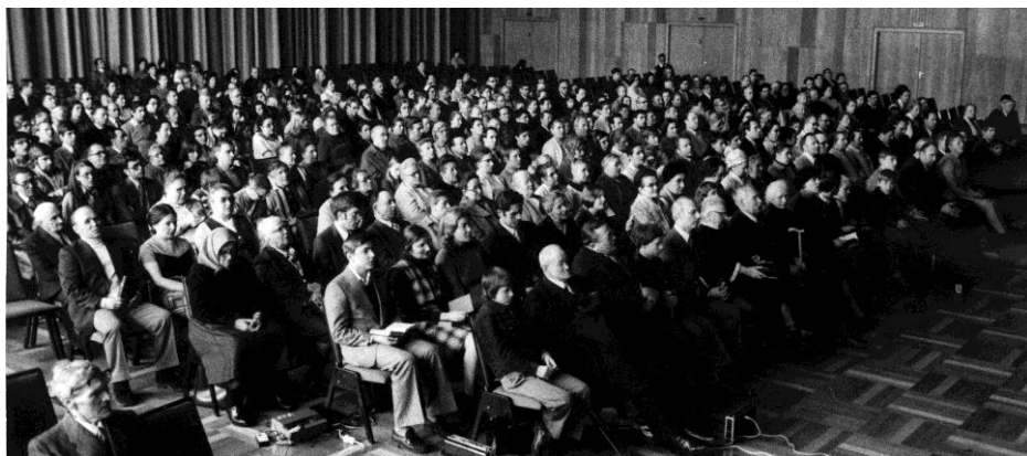
O adunare în Heilbronn, Germania, Paște – 1975