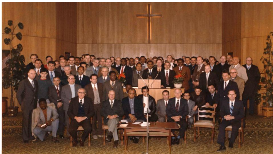
O fotografie de la o conferință cu frații slujitori, din aprilie 1976, la care au participat frați din 33 de țări

Având în vedere cei 50 de ani care au trecut, noi avem multe amintiri scumpe din adunări de pe întreg Pământul.