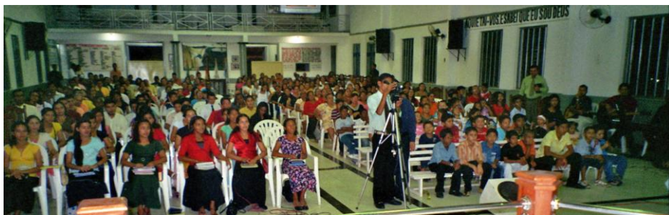
Adunare în Brazilia