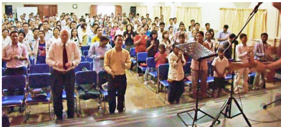
O fotografie din Phnom Penh, Cambodgia