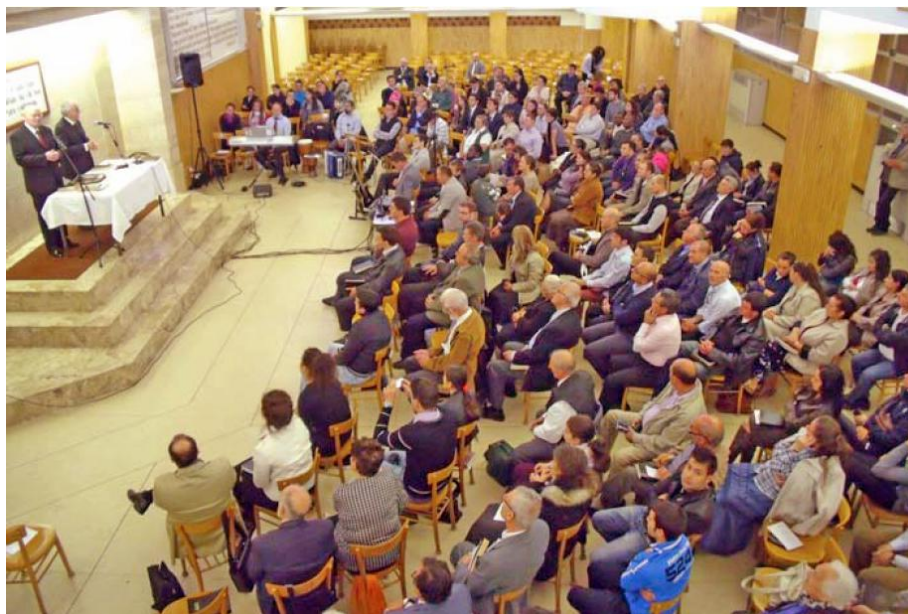
Adunarea din Roma, Italia