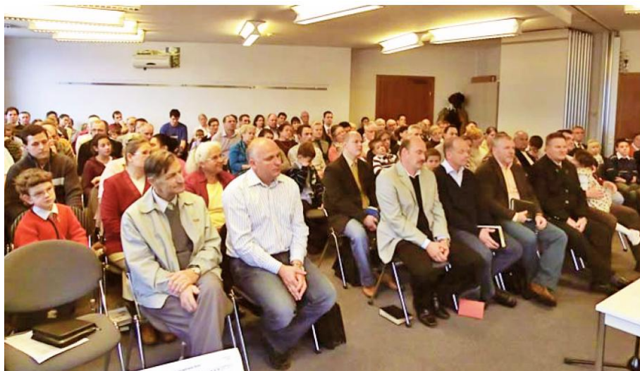
Adunarea din Graz, Austria