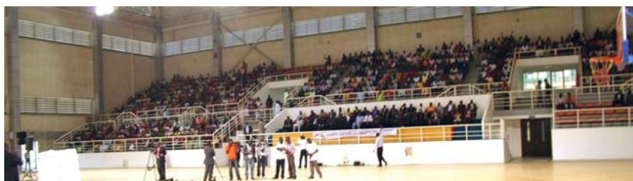
O parte din mulțimea adunată pe un stadion din Luanda, Angola