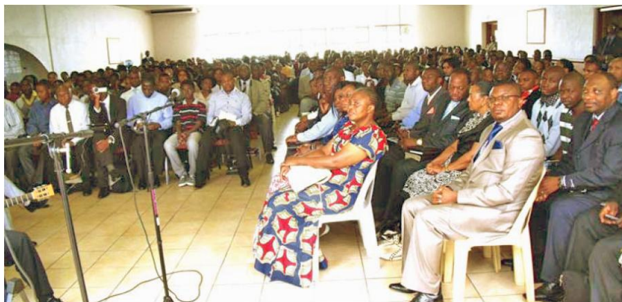
O adunare în Johannesburg