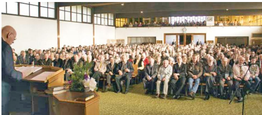
O fotografie a adunării din 5 februarie 2012, la Centrul de Misiune din Krefeld, Germania

Puteți să ascultați în direct, prin internet, adunările noastre lunare în primul sfârșit de săptămână al fiecărei luni – sâmbătă la ora 19:30 și duminică la ora 10:00 ora Europei Centrale (ora 20:30 și 11:00 pentru România). Adunările sunt transmise în lumea întreagă, în 12 limbi - [inclusiv în limba română - n.tr.]. Să aveți parte de ceea ce face Dumnezeu în prezent conform planului Său de mântuire!