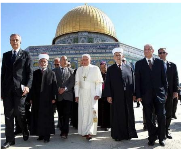
O fotografie cu Papa și reprezentanții palestinieni în fața Domului Stâncii pe Muntele Templului

Acest legământ are loc aproximativ în același timp cu începutul celei de-a 70-a săptămâni și cu răpirea Miresei, spunea fratele Branham pe 6 august 1961. Desăvârșirea planului lui Dumnezeu de